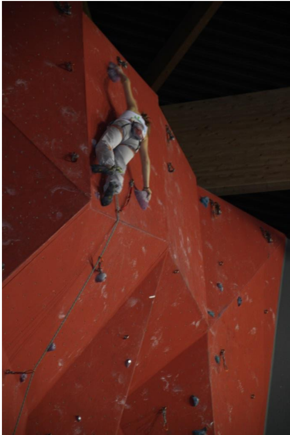
La fin en réta (pas si facile que ça !)