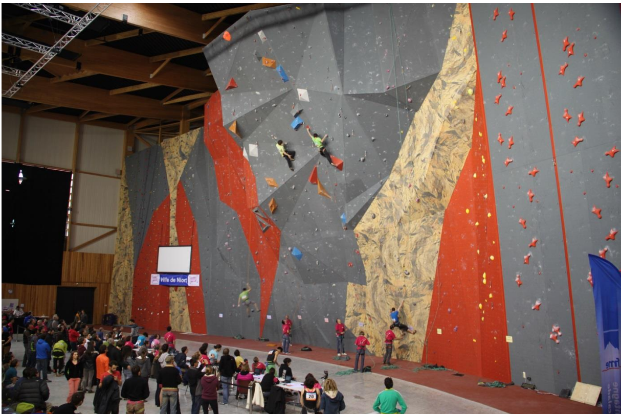
Sylvain toujours dans la Q1, avec un copain avec qui parler à côté (avec un T-shirt verte en plus !) Et un petit aperçu du mur par la même occasion...