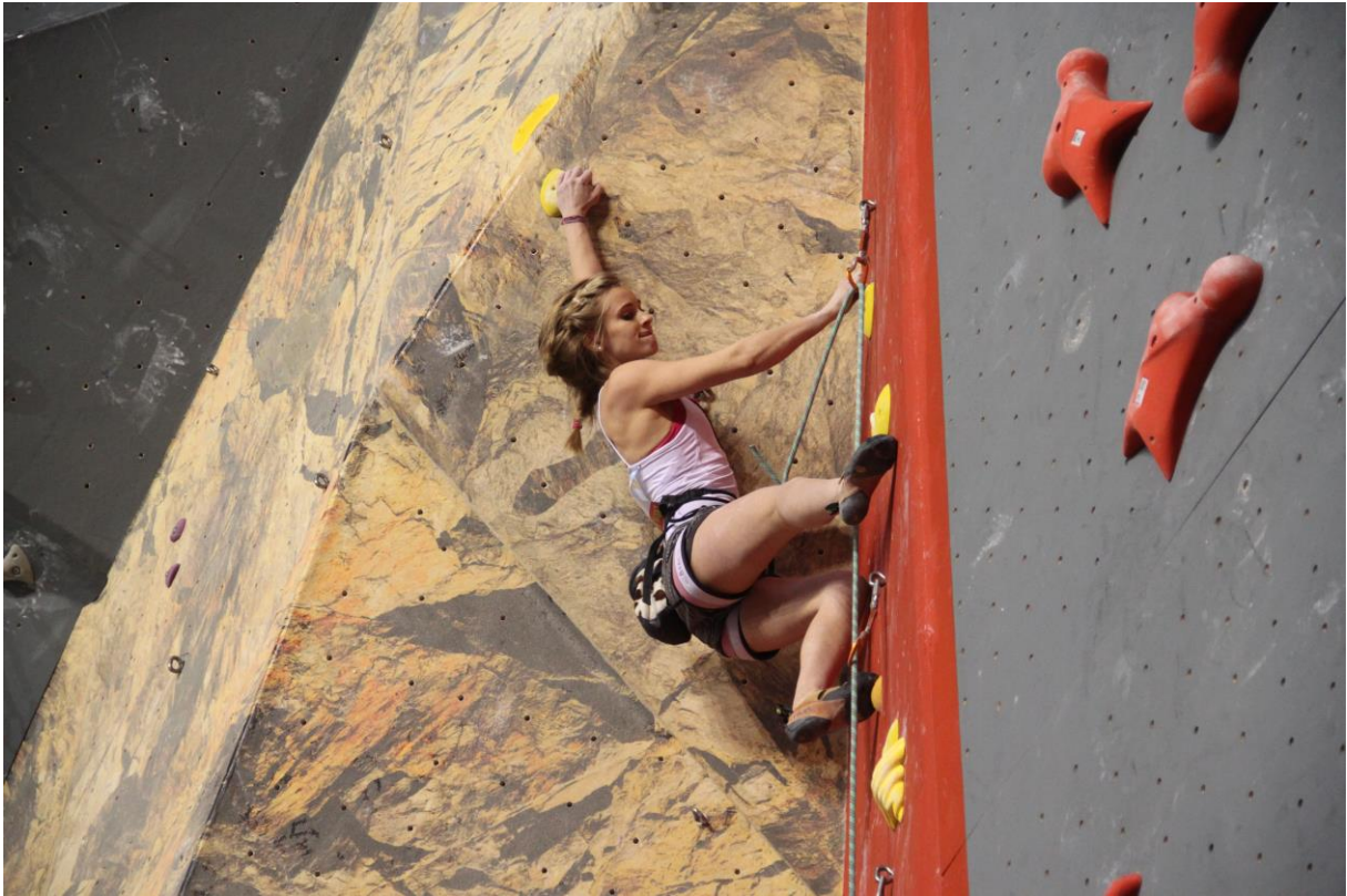
Jusqu'au bout c'est déstabilisant... Faut s'appliquer !