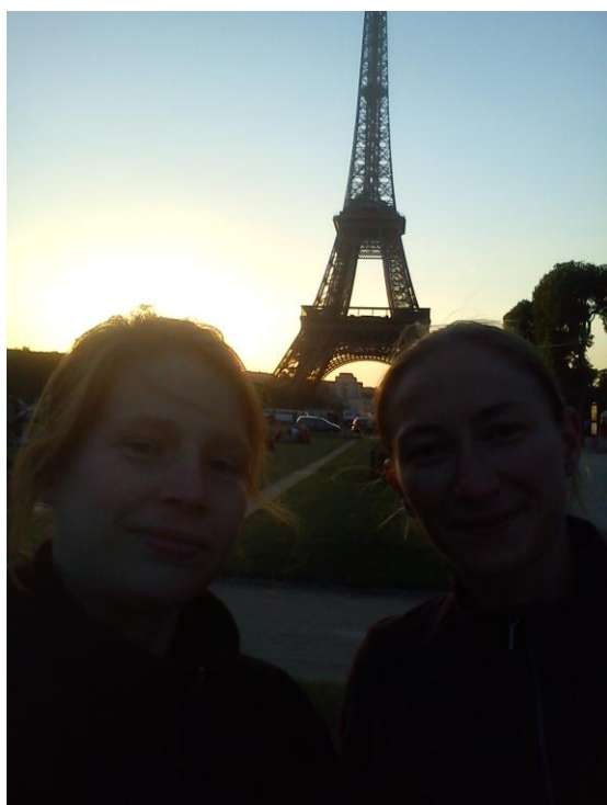
Si si, on y était !

La journée s'est achevée par un pique-nique au coucher du soleil, face à la Tour Eiffel, en attendant le train du retour (au passage, très inconfortable).