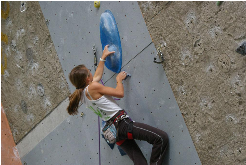
La rondasse bleue maudite !