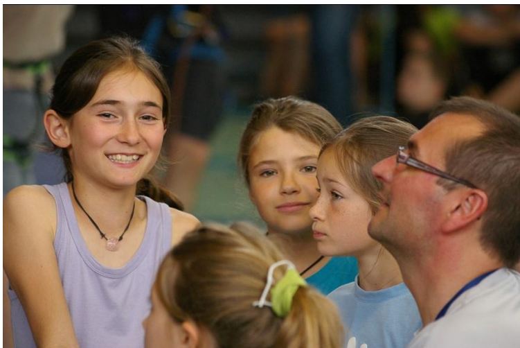
La « team » des 3 poussines