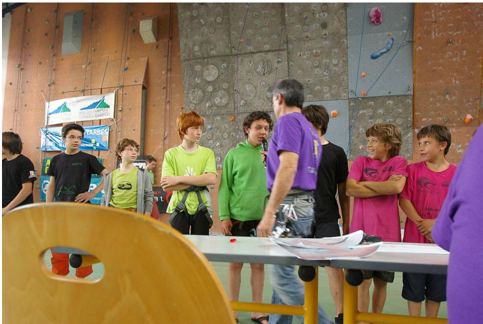
Présentation des finalistes masculins

10 TAGeurs en finale au TOP, c'est vraiment bien, mais il reste maintenant à monter sur quelques podiums, et là, c'est pas donné, tout se joue maintenant sur une voie, sur LA voie. Les voies sont belles, assez atypiques pour nos grimpeurs, avec des petites prises sur la structure elle-même, des voies très traversantes, mélangeant petites prises crochetantes, boules, aplats, saucisses, dièdres, rétablissements en force, bref un bon panel pour des grimpeurs complets.