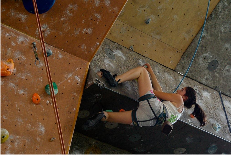
Salomé qui sort d'un toit, pour retrouver un autre toit...argh !