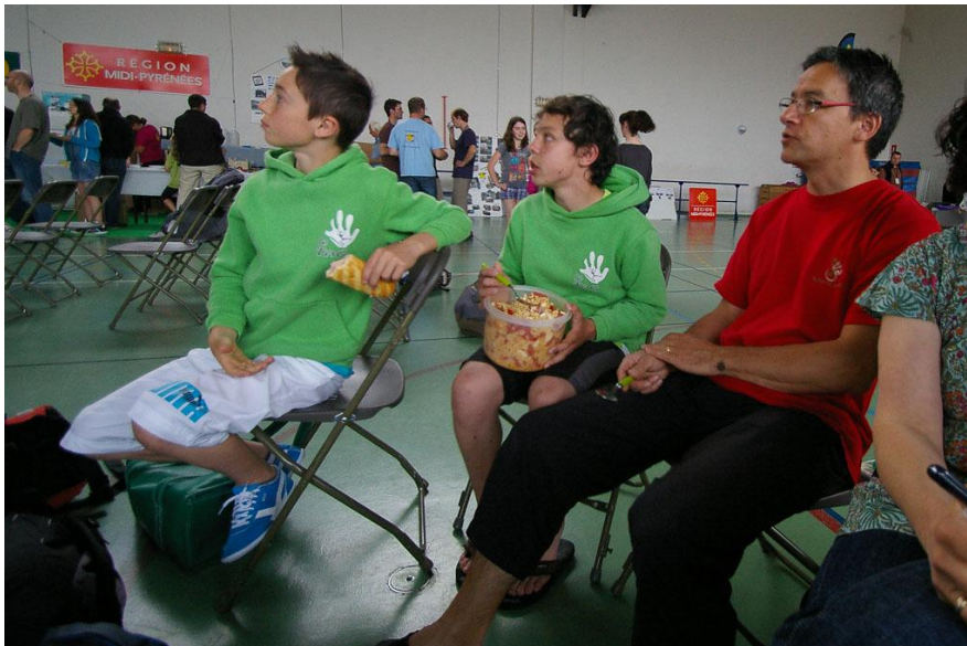
Mini sandwich ou méga salade, peu importe, chacun sa technique...