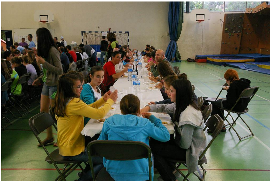
La table du TAG, avec en bout quelques accompagnants de Fonsorbes et Pibrac également.

18h, fin de ces premières qualifs. Bonne journée qu'il faudra poursuivre encore demain. En attendant, prise des chambres à l'hôtel ou chez l'"habitant" pour certains, et tout le monde ou presque se retrouve au repas du gymnase à 20h, avec du taboulé pour les doigts, des lasagnes pour les bras, et un éclair au chocolat pour les abdos. Il faudra bien ça pour demain !