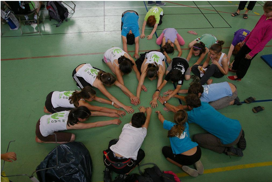
Un jungle speed géant ? La roue de la fortune ? Une lentille perdue ?